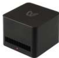
25 GH/S BITCOIN MINER