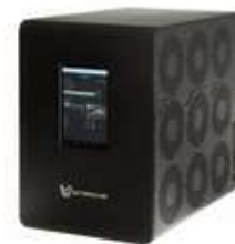
1,500 GH/S BITCOIN MINER